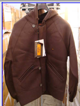
Felpa Termica Uomo Mod. 02 Vintage Made in Italy